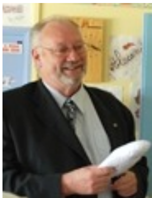
Bernard Tesse, Governatore Francia-Monaco

All'interno del distretto è in corso una riflessione sulla realizzazione del Service da fare tutti insieme in occasione del D day (sbarco alleato in Normandia) il 7 aprile.